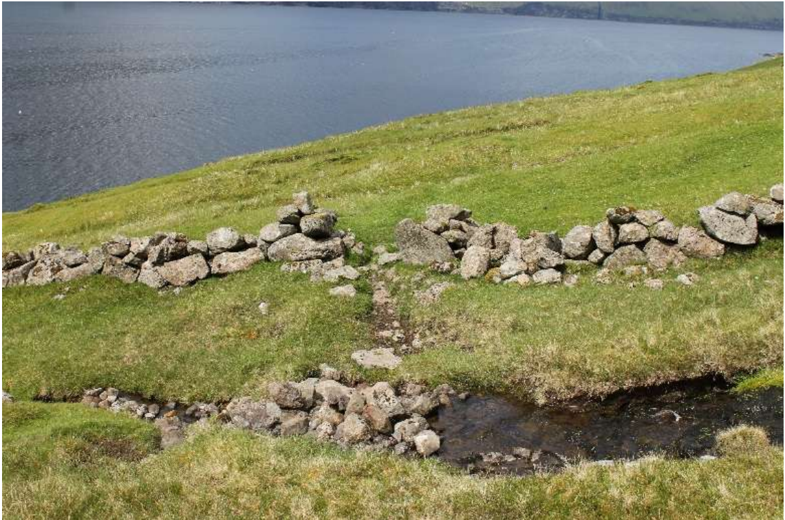
Portrið inn í bygdina