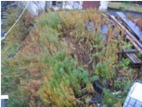
Dúnurt (veksur sum ókrút allastaðni)