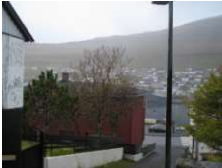
Øsp ( Populus )