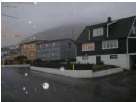
Elstu húsini í grannalagnum