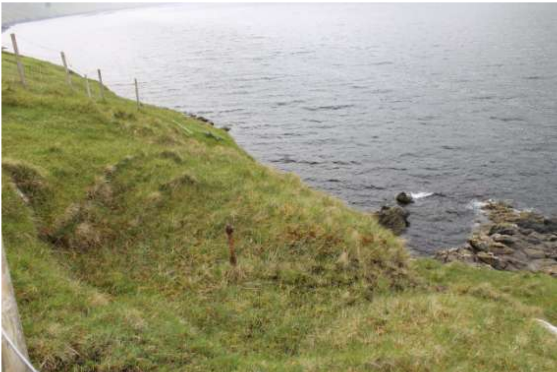
Jarnkongur til dragispæl á Kleivini