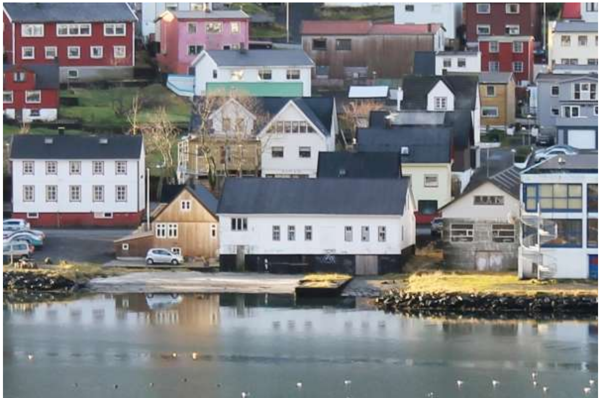
Nýggj mynd av seglhúsinum (5. nov. 2014)