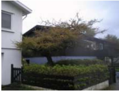
Lerkur Larix (veksur eftir vindinum)