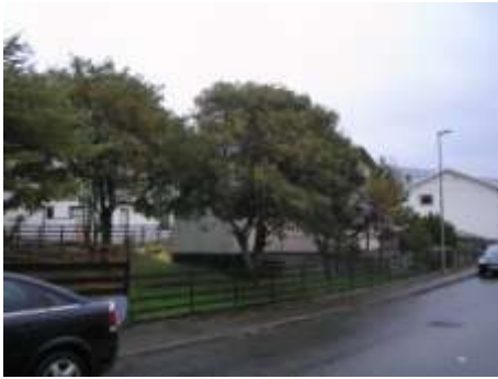
Ahorn Acer við Jörundsgötu