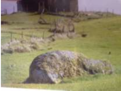
Mynd úr Klaksvíkar Sögu II

Her var glaðað út til Oyrar, tá grindaboð vóru av Vágni.