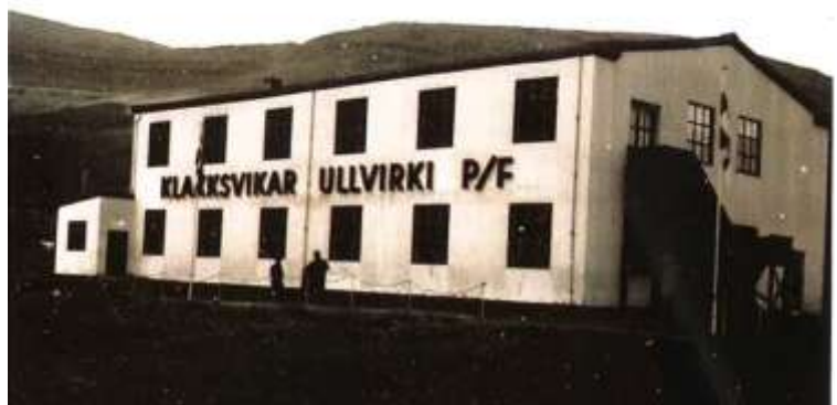
Lænt úr heftinum hjá Grunnurinn Spinnaríð