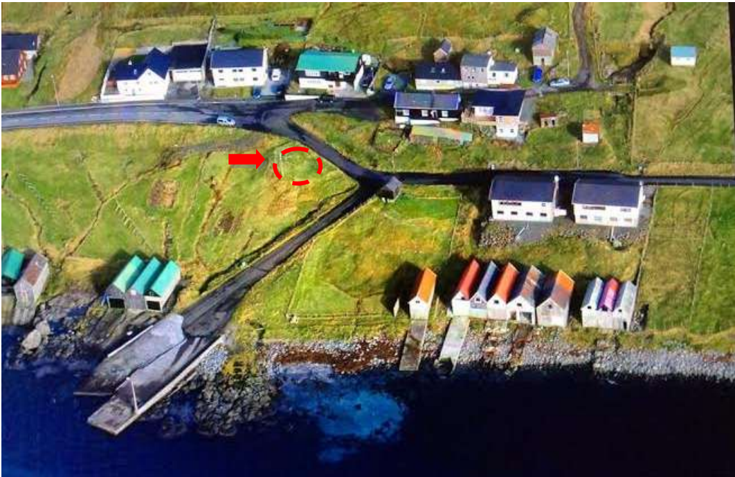
Bønhústoft. 12. oktober 2014

Her skal bønhúsið á Oyri hava staðið, og tá ið teir gjørdu vegin oman á Skálaberg, gróvu teir ígjøgnum og komu fram á steinseting, men enn er nógv eftir niðanfyrri vegin. Bønhúsgarðurin er friðaður sambært lóg frá 1948. Á økinum standa træpelar – helst til at festa jólatræið í. Farast eigur varisliga fram á økinum.