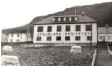
"Gamlar myndir í Norðoyggjum" 1958

Í dag eigur kommunan bygningin, sum hýsir Íverksetara-húsinum. Bygningsskapið er upprunaligt, men bæði klædningur, tak og vindeygu er broytt. Bygningurin verður nú umvældur, men bólkurin harmast um tað, sum gjørt er við takið og kvistin.