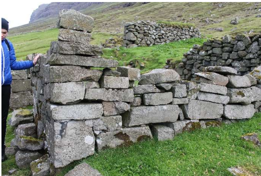
Ítrív hjá seinastu búfólkunum er enn at siggja