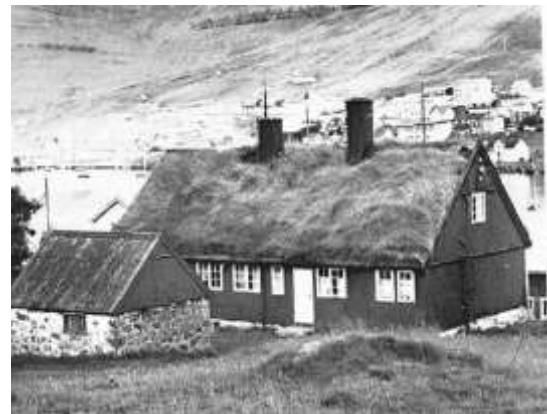
Gomlu sýslumanshúsini – bygd í 1860unum.