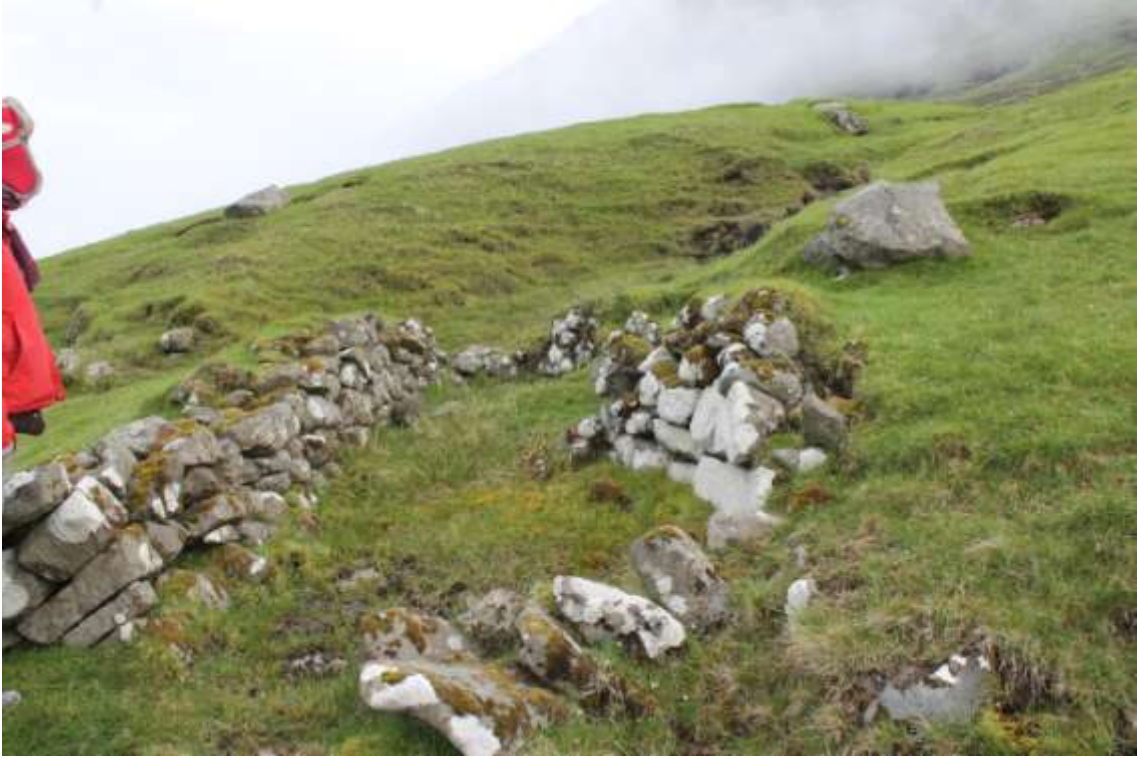
Neystatofn við Kleivina