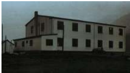
Lænt úr heftinum hjá Grunnurinn Spinnaríð

Bygningurinn er frá uml. 1944. Ullvirkið var í nýtslu árinum 1944-1964. Á loftinum var fiskaturkarí frá 1954 og nokkur ár fram. Undir kríggjum voru takflísar – reyðar á liti – stoyptar í bygninginum. Takflísarnar voru brúktar til Spinnaríð, skrivstofuna hjá Kjølbro á Stongunum og fjósið hjá Kjølbro. Mælt verður til, at upprunabygningurinn verður varðveittur so upprunaligur sum til ber, men bólkurinn setir seg tó ekki í móti mögulegum útbyggingum.