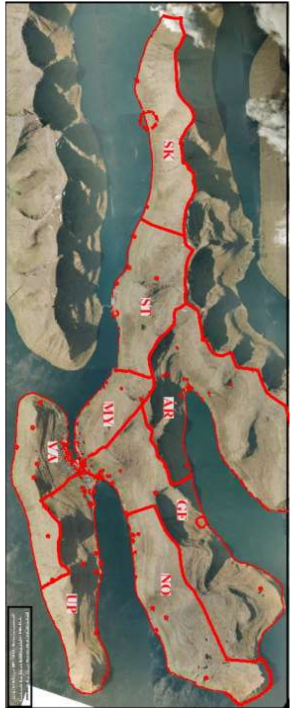
FDS - kort