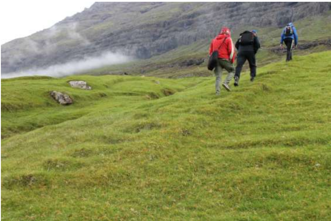
Týðilig spor síggjast av trapputrinum niðanfrá bakkanum