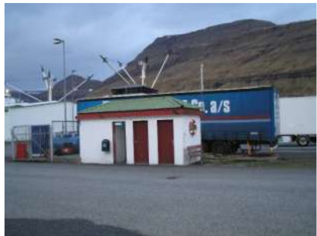
"Gamlar myndir úr Norðoyggjum" FB á alnetinum