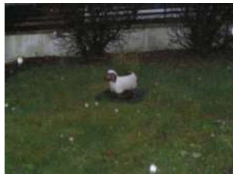
Trappusteinarin í Køkinum á Uppsløsum er varðveittur